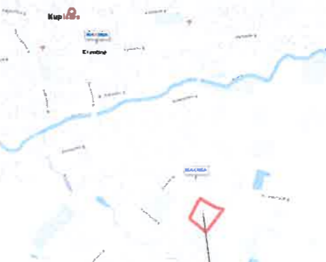
SITUACIJOS PLANAS Planuojamos teritorijos vieta Kupiškio mieste