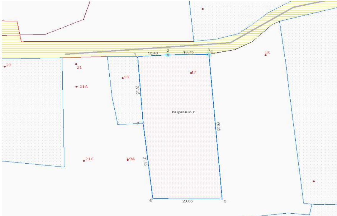
1 pav. gretimybės ir įvažiavimo schema

Gretimybėje 1-...-4 formuojamas sklypas ribojasi su Žemaitės gatve, 4-5-6-7 valstybine nesuformuota žeme - LŽF, 7-1 su sklypu kad.nr. 5720/0006:0021 (atlikti kadastriniai matavimai).