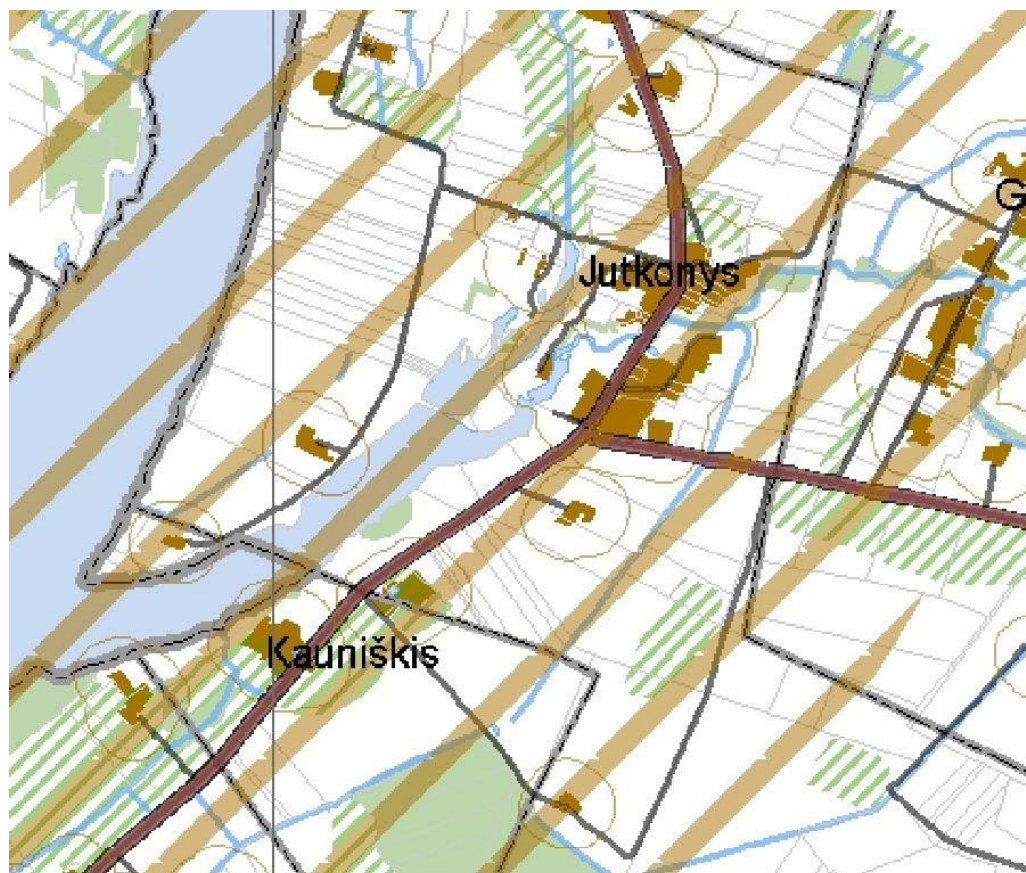
1.2 pav. Ištrauka iš Kupiškio rajono savivaldybės teritorijos bendrojo plano (žemės naudojimas ir apsaugos reglamentų brėžinys)

Pagal Kupiškio rajono savivaldybės teritorijos bendrojo plano sprendinius, žemės naudojimo ir apsaugos reglamentų, projektuojama teritorija pakliūna į tankiausiai apgyvendinta rajono dalį 1.2 pav.